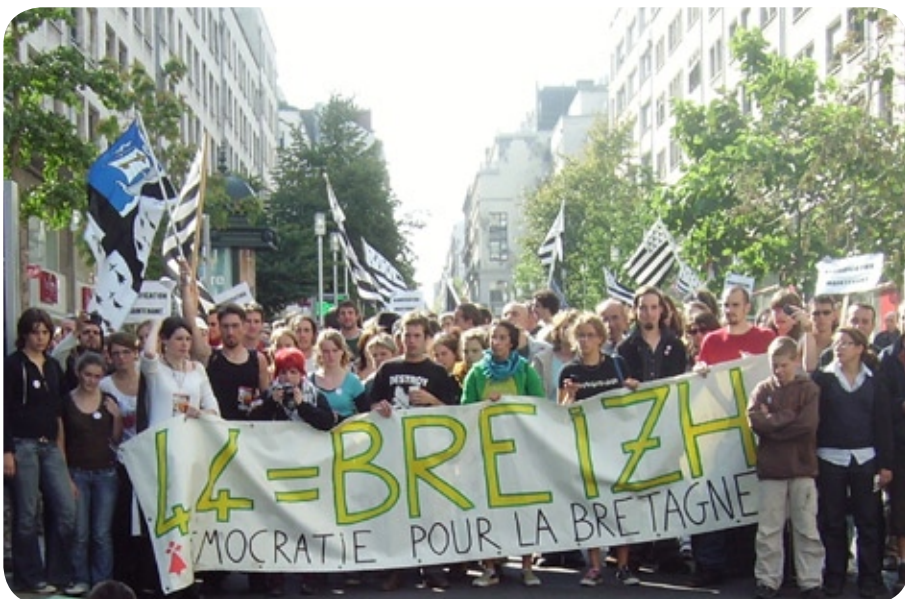
Photo prise lors de la Festima-nif du 20 septembre 2008 à Nantes.

Dans ce cas là il ne faudrait pas faire de région « Grand Ouest » non plus. Et puis, à part pour le foot et les dirigeants de ces municipalités, y a-t-il de véritables divergences ? Les maires de Nantes et Rennes ne veulent pas se prononcer en faveur de la Réunification car ils ont peur d'y perdre la place de capitale-métropole régionale, et ils voient sans doute plus d'intérêts à faire une compétition économique et démographique entre les deux villes. Pourtant, à l'image de ce qui se passe ailleurs en Europe, nous pourrions imaginer une mise en réseau et une répartition des compétences entre les grandes villes bretonnes, pour homogénéiser et pérenniser le développement du territoire. Le système concentrationnaire français a depuis longtemps montré ses défaillances.