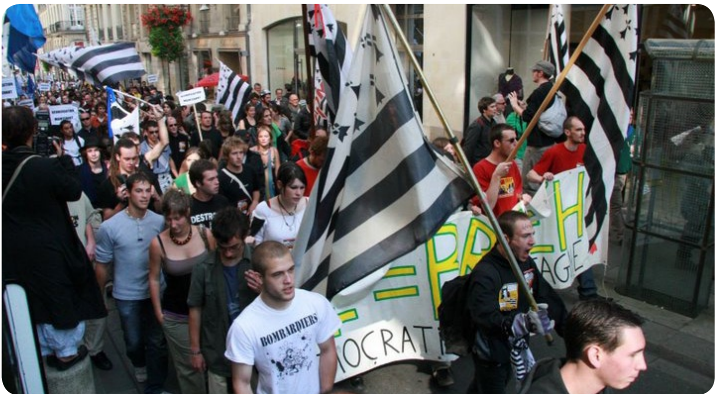
Cortège des jeunes de 44=Breizh le 20 septembre 2008 à Nantes.